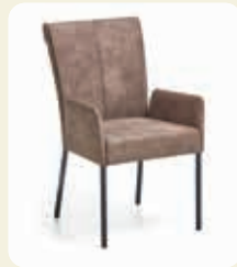
Armlehnstuhl. 4-Fußgestell Rundrohr Eisen schwarz, Bezug Microfaser Schlamm