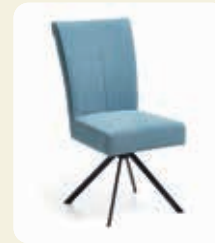
Stuhl. Gestell Stativ Metall schwarz, Bezug 100% PET- Recycling Eisblau