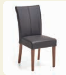
Stuhl. 4-Fußgestell Wild-Nussbaum, Bezug Echtleder Mocca