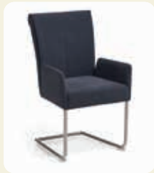
Armlehn-Schwingstuhl. Gestell Rundrohr Edelstahl gebürstet, Bezug 100% PET- Recycling Graphit