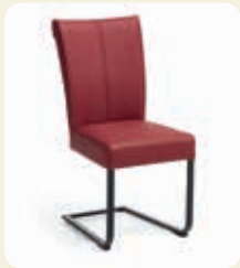
Schwingstuhl. Gestell Flachstahl Eisen schwarz, Bezug Echtleder Rubin

Über 1.500 mögliche Stuhlkombinationen! Die Sitzschalen und Stuhlgestelle sind beliebig kombinierbar.