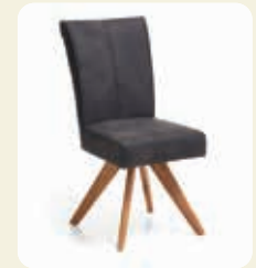
Stuhl. Gestell Stativ Wildeiche massiv, Bezug Microfaser Anthrazit